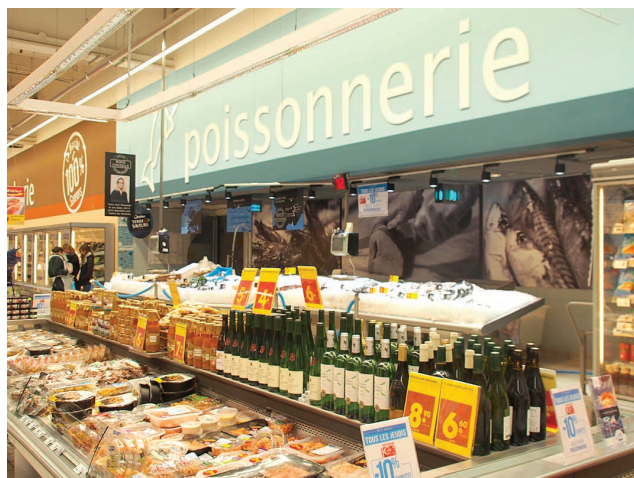
La poissonnerie du Géant Casino de Villefranche, premier partenaire de la campagne.