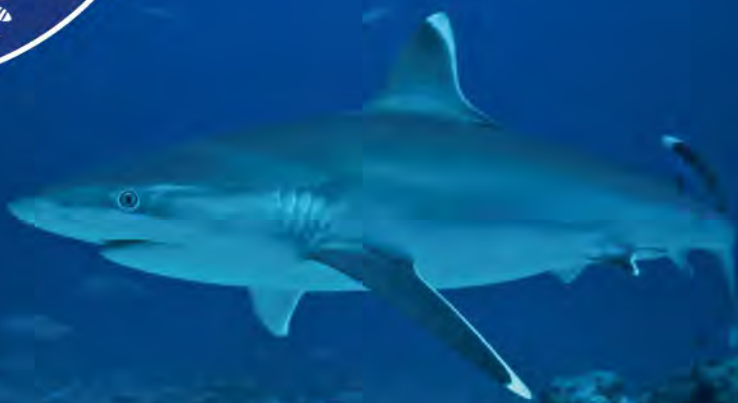
Requin pointe blanche ( Carcharhinus albimarginatus )