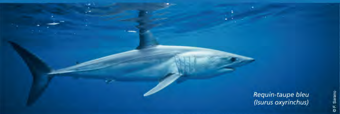
Requin-taupe bleu ( Isurus oxyrinchus )